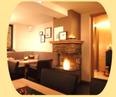
Feuer mit Fa. Aland Großartiges Ambiente im Hotel